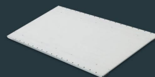
TRAVERSE AVEC RENFORT